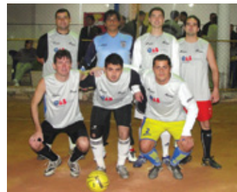
Time 10: Campeão