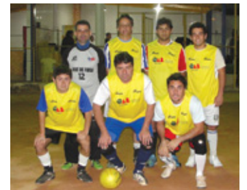
Time 11: 3º colocado

Promovido pela Comissão de Esporte e Lazer, o 5º Torneio de Pelada da OAB/JF movimentou o Clube Bom Pastor entre os meses de maio e agosto.