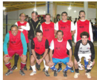
Time 2: 2º colocado