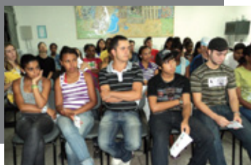
Alunos de uma das 15 escolas atendidas pelo projeto atentos à apresentação

A publicação será distribuída em escolas, faculdades, órgãos públicos e associações.